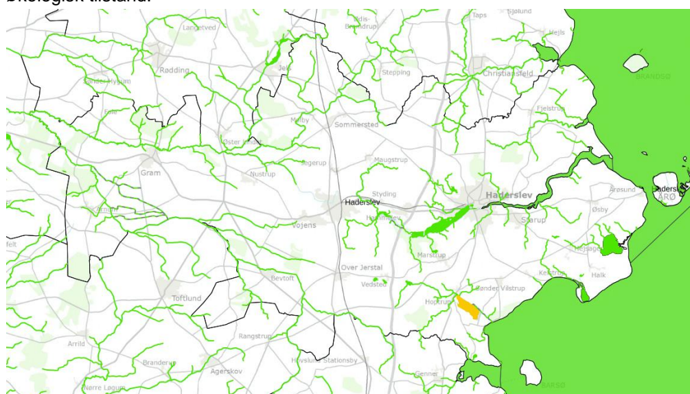
Figur 3 Vandområdeplan 2015-2021 målsætninger i Haderslev Kommune

Lillebælt og Vadehavet, samt alle vandløbene i Haderslev Kommune er i vandområdeplan 2015-2021 målsat til "god økologisk tilstand". Kystvandet, Lillebælt, ud for Haderslev Kommune er ligeledes målsat "god økologisk tilstand". Målsætningerne kan ses på Figur . Vandløb, søer og kyster der er markeret med grøn har en samlet god økologisk tilstand. Gul markering betyder at vandløbet, søen, kysten har en samlet moderat økologisk tilstand.