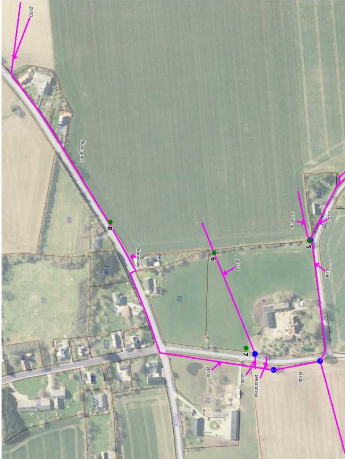
Figur 1: Kort over drænledninger før minivådområdets etablering