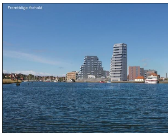
Visualisering - projektændring

Ansøgningen og beskrivelse af projektændringen er vedlagt som bilag B.