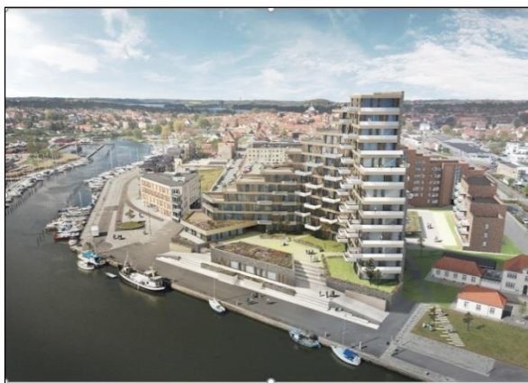
Visualisering - godkendt projekt

Ved projektændringen bliver bygningen delt i to "tårne", så der skabes luft imellem bygningerne. Der sker en reduktion i bygningsmassen, og byggeriets maksimale højde reduceres med 5 m.