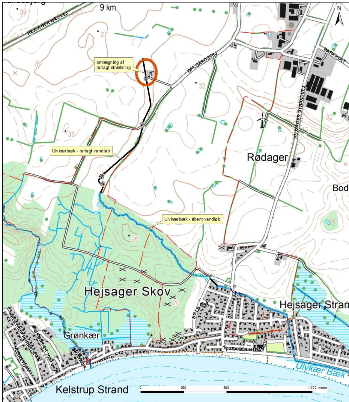
Figur 1. Oversigtskort over Ulvkær bæk. Strækningen der er reguleret/omlagt er beliggende ved den røde markering.