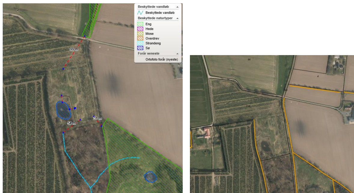
Figur 4: Beskyttede naturtyper tæt ved projektområdet og beskyttede diger.