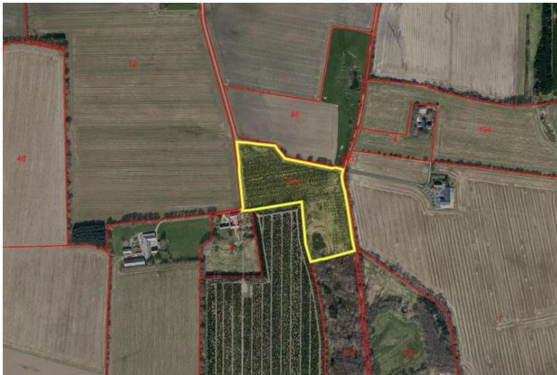
Figur 1: Matr.nr. 214, V. Linde, Gram

Minivådområder er et slags filter, som renser drænvand for kvælstof og fosfor før udledning til recipient og vandmiljø. De fungerer i praksis ved at man udnytter områdets terræn til at etablere minivådområdet uden at der er behov for at pumpe vand dertil. Drænvandet ledes ind i anlægget fra eksisterende brønd eller alternativt direkte via drænledningen. Efter drænvandet har passeret minivådområdet, ledes det frit ud over en iltningstrappe eller ilttes i en brønd, hvorefter det tilkøbes det eksisterende dræn. Entreprenøren har metodefrihed og den faktiske udformning afgøres af, hvad der er praktisk muligt.