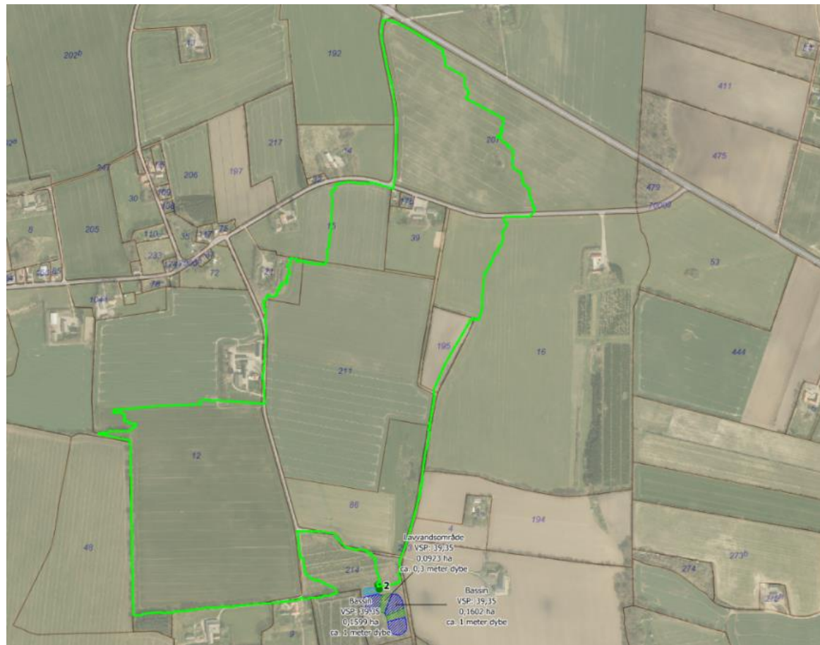
Figur 3: Drænopland til minivådområdet.

I dette projekt er drænoplandets størrelse på ca. 70,61 ha. Det er estimeret, at der udledes 70,6 l pr. sek. drænvand ud af minivådområdet, men den maksimale drænudledning fra minivådområdet kan variere betydeligt fra afstrømningssæson til afstrømningssæson. Drænsystemet afvander til det beskyttede vandløb syd for minivådområdet som tilløber til Gram Å.