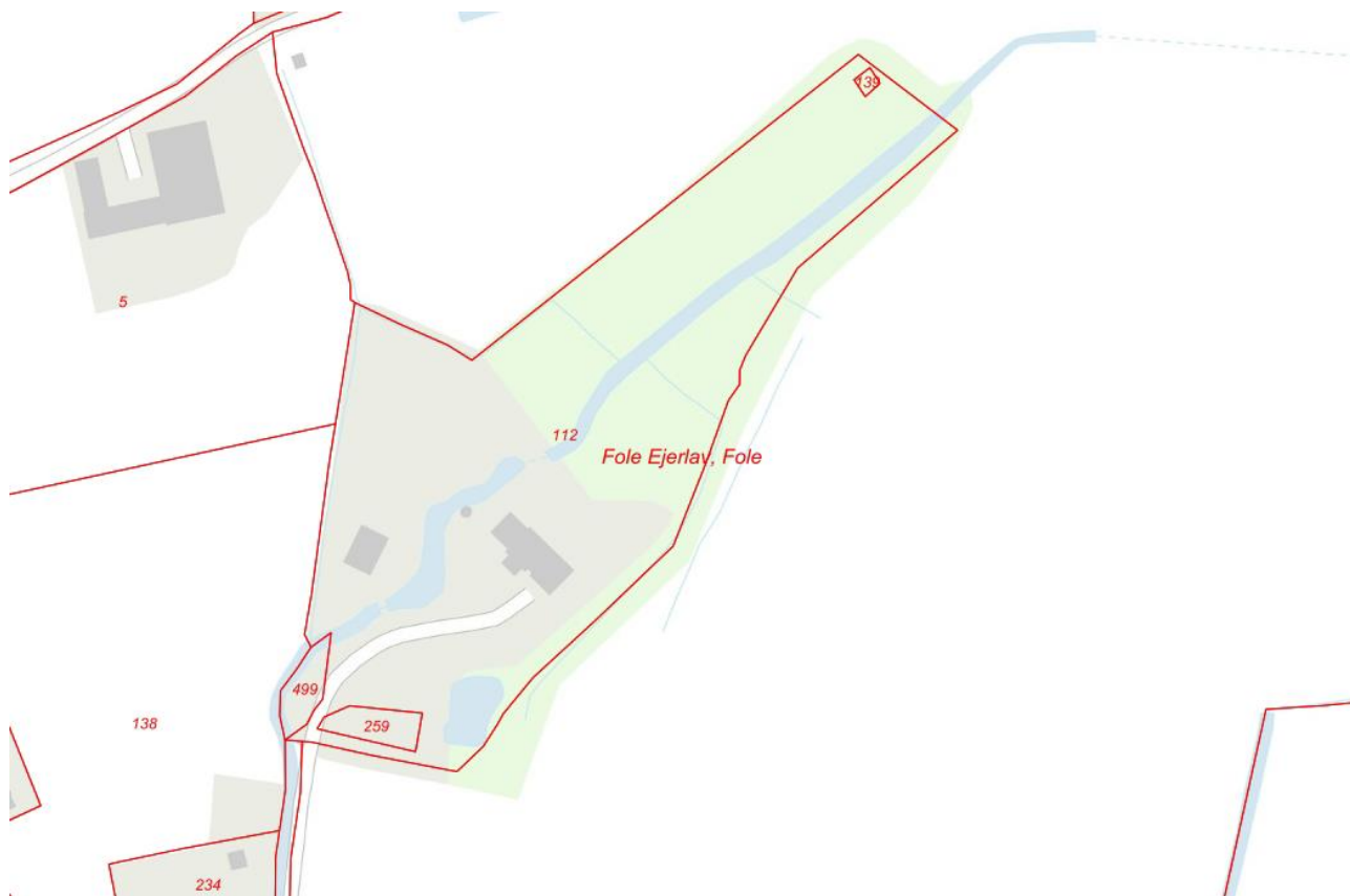
Oversigtskort og detailplan

Placering af klimadiget er på adressen Hygumvej 10, matrikel nr. 112 Fole Ejerlav, Fole